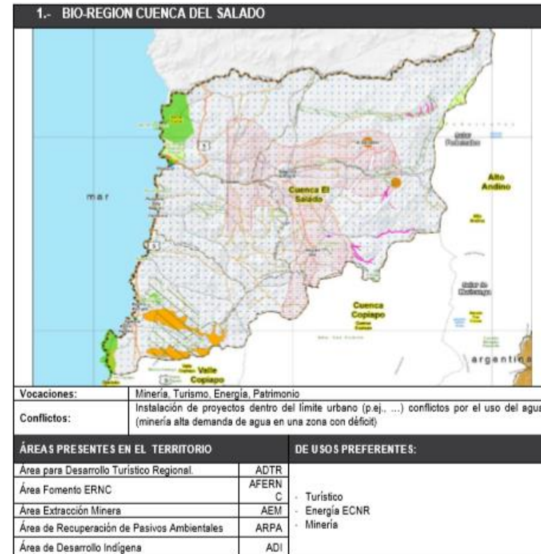
Zonificación por sub-territorio – Anteproyecto PROT Región de Atacama.