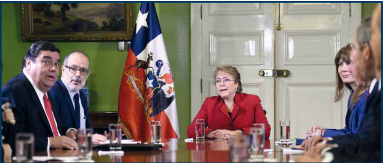
El tema central de la reunión fue el perfeccionamiento al sistema de pensiones