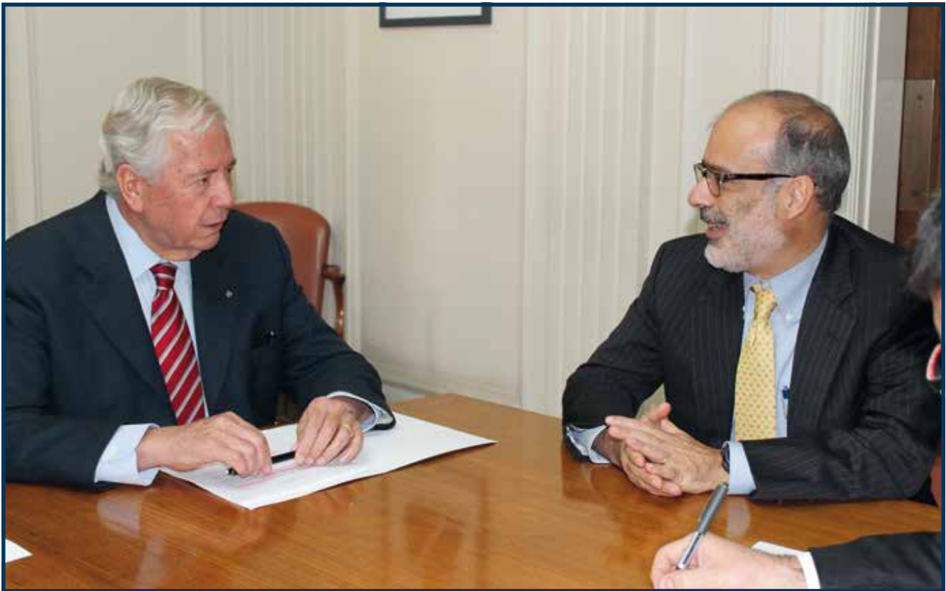
El presidente de SOFOFA, Hermann von Mühlenbrock y el ministro de Hacienda, Rodrigo Valdés

Además, en la cita se manifestó a la autoridad las inquietudes de la industria respecto de ciertas iniciativas en trámite en el Congreso Nacional como aquella que reforma el Código de Aguas, la que estableció cuotas para personas con discapacidad, la que modernizó la legislación aduanera, o la que dispone la elección popular del órgano ejecutivo del gobierno regional, entre otras materias.