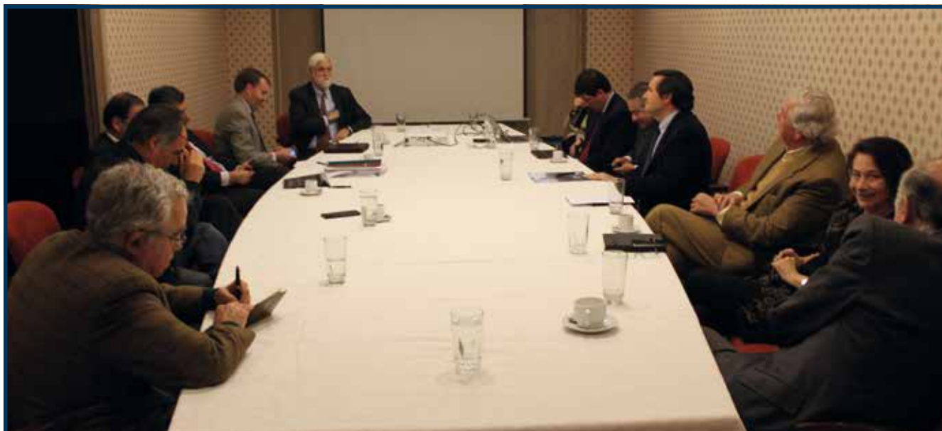
Integrantes del Comité Previsional

Como continuidad del Comité Pro-Reciclaje, constituido para actuar como contraparte ante la elaboración de la denominada “Ley de Responsabilidad Extendida del Productor (REP)”, en 2016, SOFOFA constituyó el Comité REP, sector envases y embalajes. Ello, con el objetivo representativo de ser la contraparte ante el desarrollo de los reglamentos asociados a la Ley REP, particularmente en lo que concierne a los sectores antes mencionado.