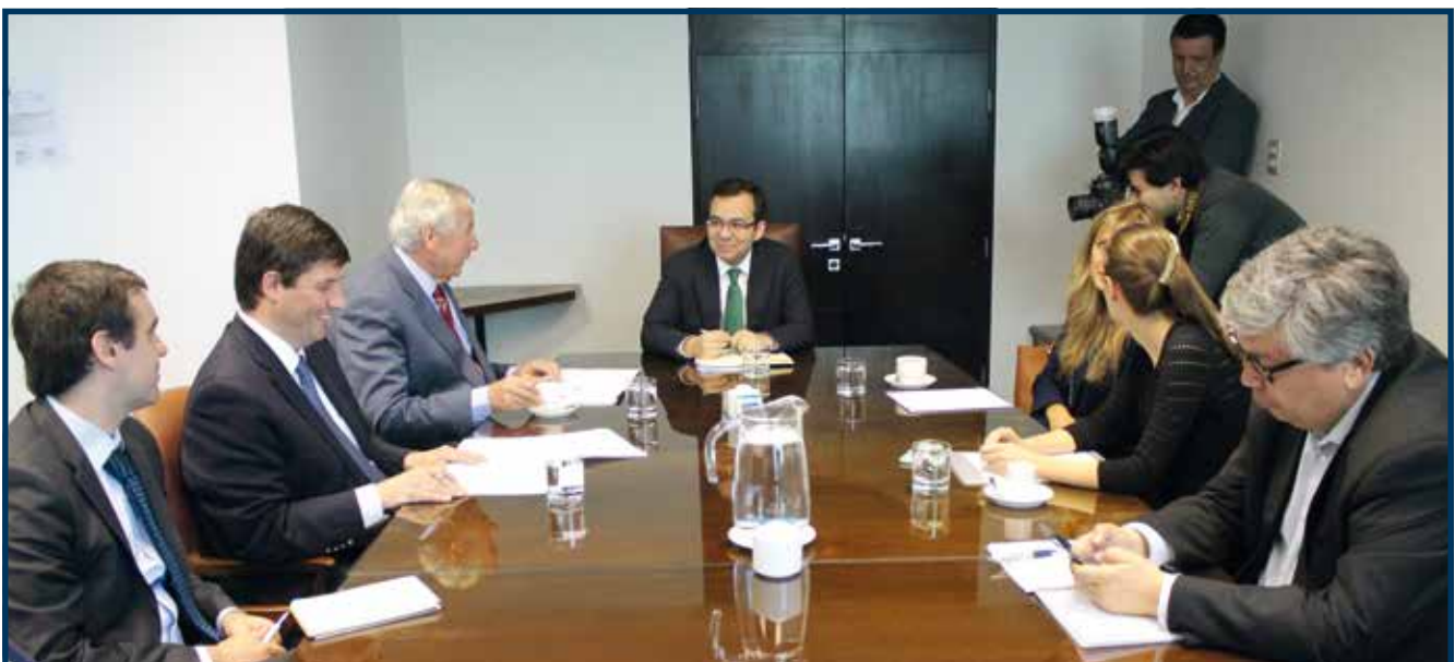
Durante la reunión con el Ministerio de Economía se trataron temas contingentes como la ley que modifica el SERNAC y la reforma al Código de Aguas, entre otros.