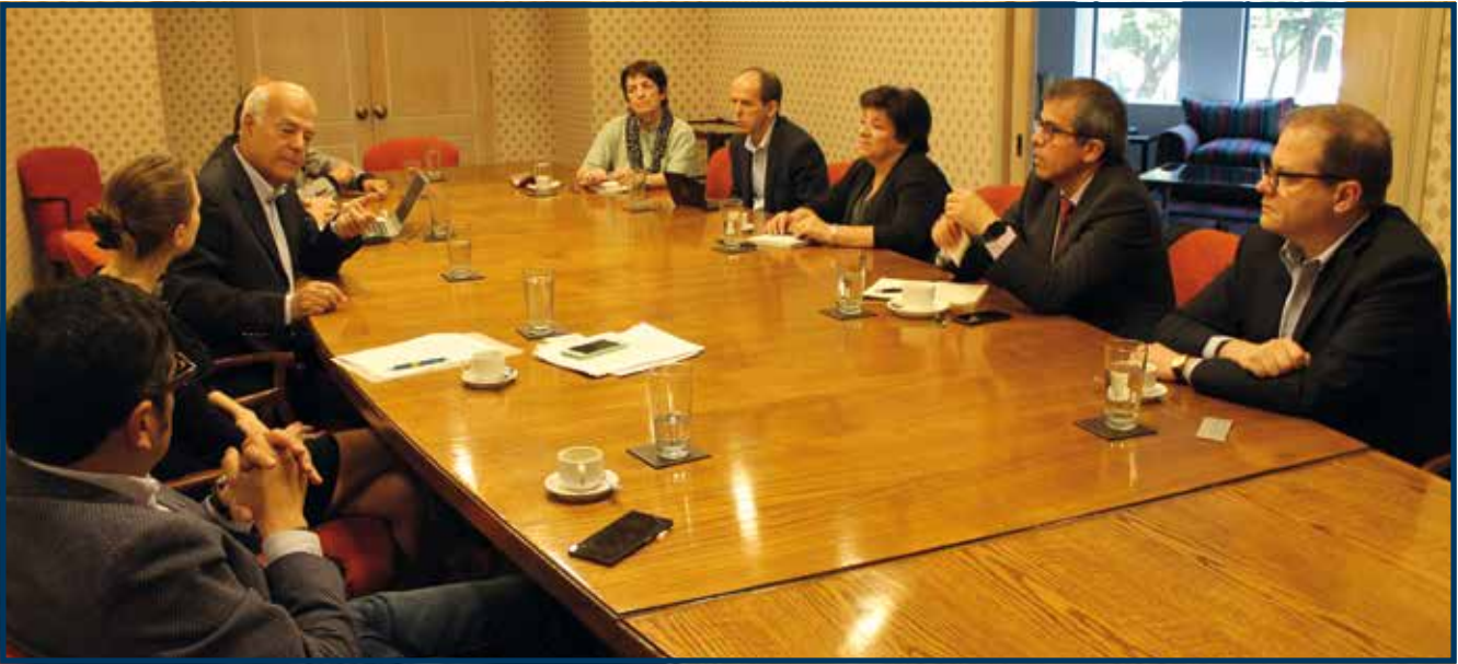
Una de la reuniones del Comité Laboral Empresarial de SOFOFA

Dada la coyuntura en materia laboral, el Observatorio se centró principalmente en analizar temas relevantes de la última Reforma Laboral, tales como, servicios mínimos y equipos de emergencia, negociación de los grupos negociadores, y derecho a la información de las organizaciones sindicales.