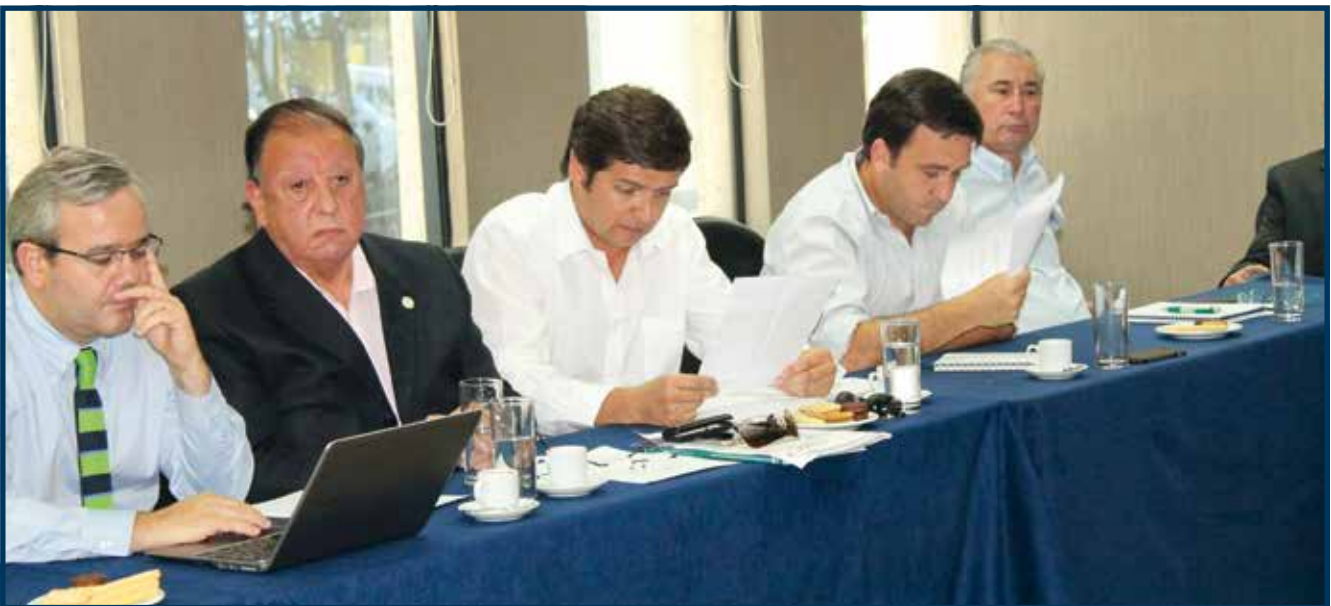
Algunos de los asistentes que participaron de esta reunión del Comité Laboral Empresarial de SOFOFA