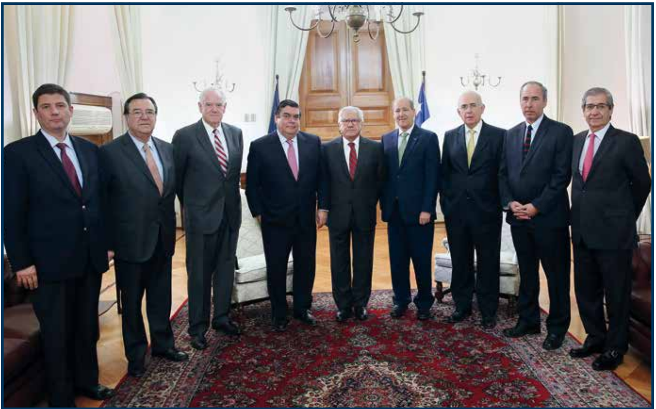
Los representantes de las 6 ramas de la CPC que se reunieron con el ministro del Interior, Mario Fernández