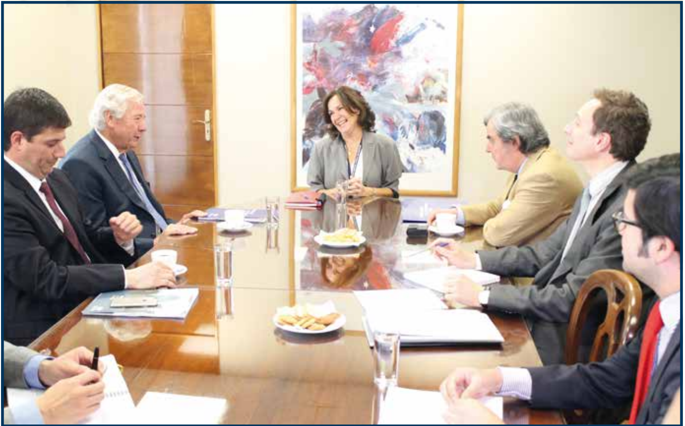
Durante la reunión con la ministra del Trabajo, Alejandra Krauss, se abordaron los desafíos de implementación de la Reforma Laboral