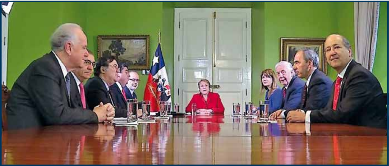
Los representantes de la CPC en reunión con la Presidenta de la República, Michelle Bachelet; el ministro de Hacienda, Rodrigo Valdés y la entonces ministra del Trabajo, Ximena Rincón

Los empresarios expresaron su disponibilidad para dialogar y colaborar en este proceso, acogiendo la invitación de la Presidenta a lograr un acuerdo nacional que permita aumentar las pensiones de los chilenos de manera sostenible en el tiempo.