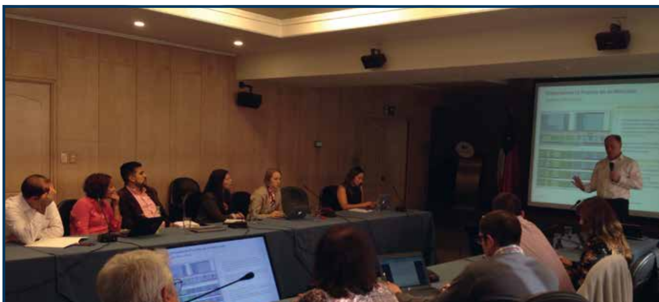
Una de las reuniones del Comité SOFOFA REP