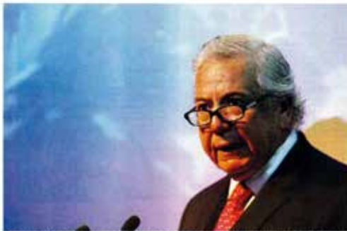
► Herman Von Mühlenbrock, presidente de la SNA, después de presenciar el lanzamiento de la Ley de Fomento del Empleo.

La reforma laboral es una modificación de la Ley de Fomento del Empleo que busca regular el mercado de trabajo y mejorar las condiciones de los trabajadores. El texto establece un nuevo modelo de contratación, que incluye la posibilidad de contratar a tiempo parcial y a tiempo indefinido. Además, se promueve la creación de puestos de trabajo a través de incentivos fiscales para las empresas que creen nuevos empleos.