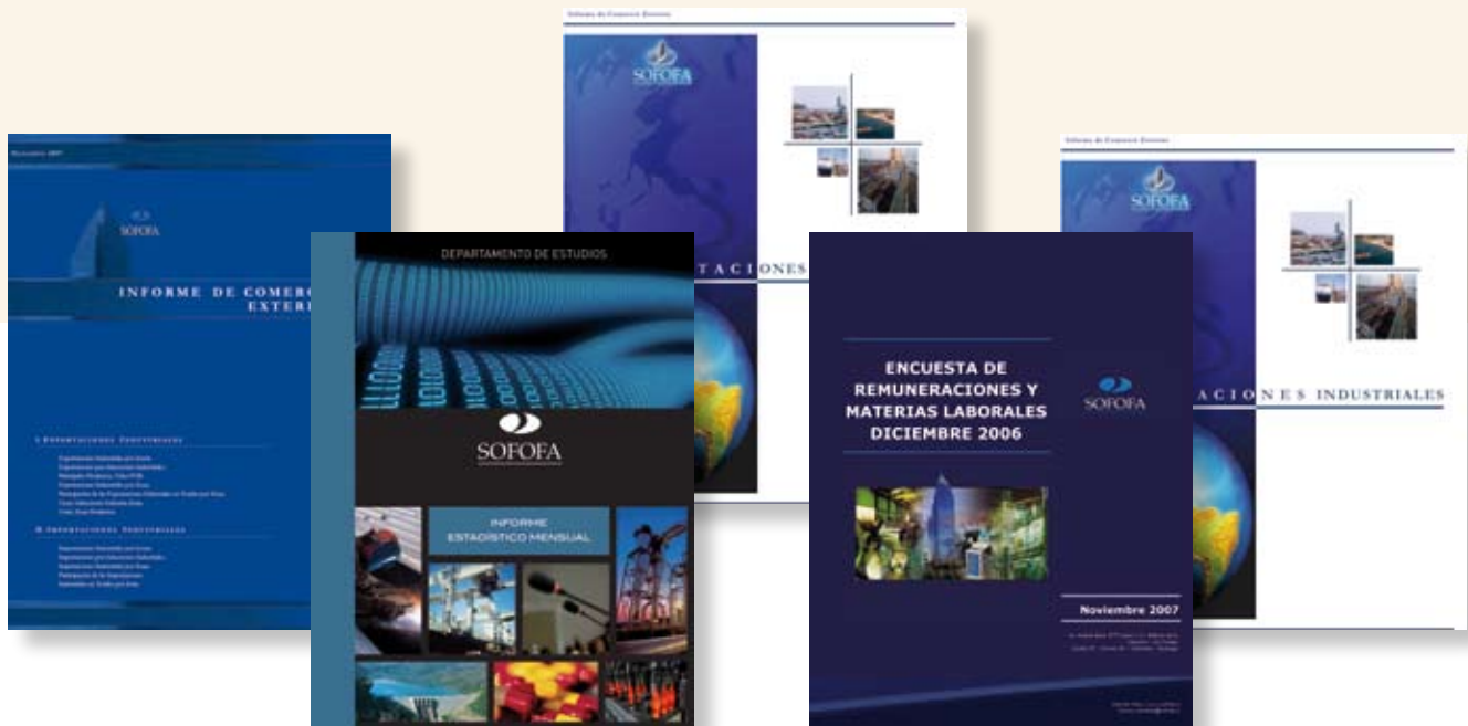
Publicaciones del Depto. de Estudios de SOFOFA