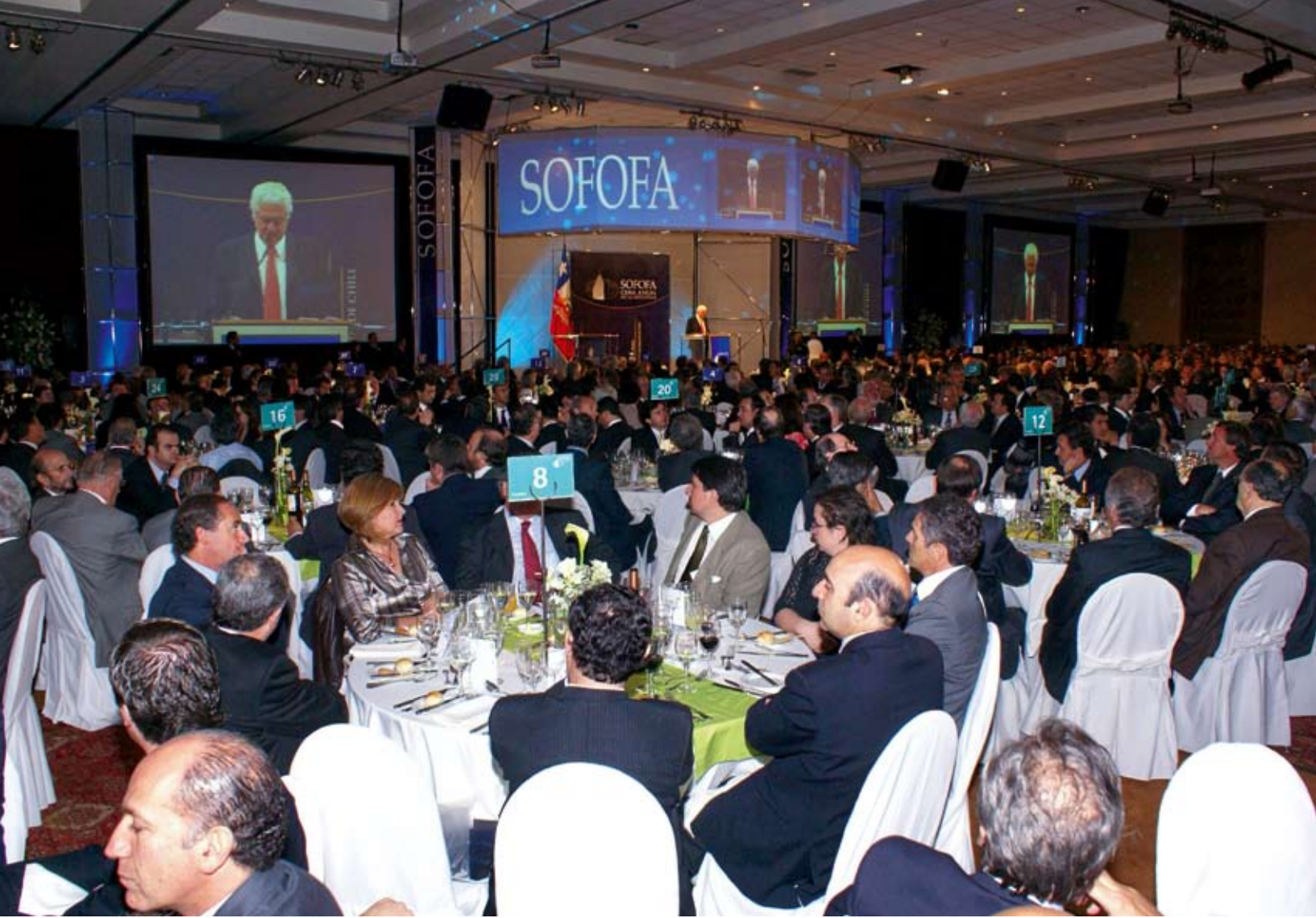
Cena Anual de la Industria 2007.