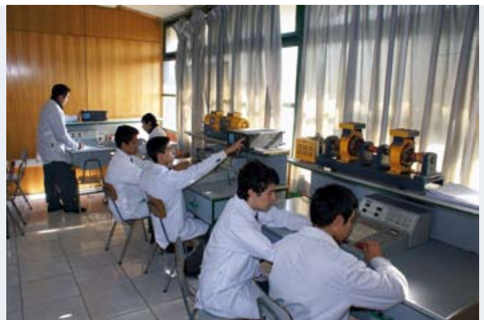
Alumnos del Liceo Ramón Barros Luco en La Cisterna