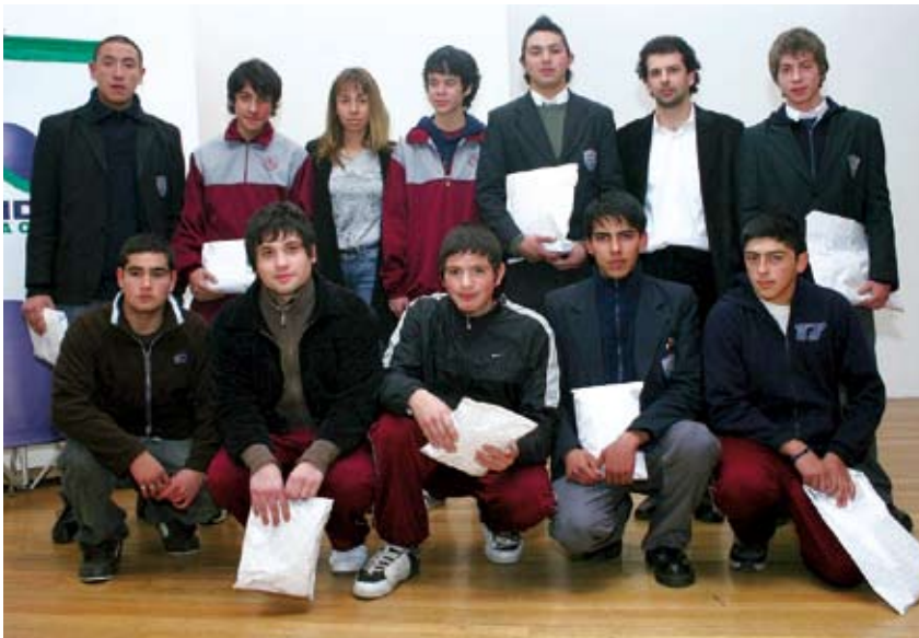
El grupo de alumnos del Liceo Agustín Edwards Ross que obtuvo el tercer lugar en el programa “Banco en Acción” del programa Junior Achievement de la Fundación Educación Empresa.

Durante el 2007 se desarrollaron 41 cursos relativos al emprendimiento, donde participaron 1.672 alumnos. Los temas abordados fueron: fundamentos empresariales, economía personal, banco en acción y las ventajas de permanecer en el liceo.