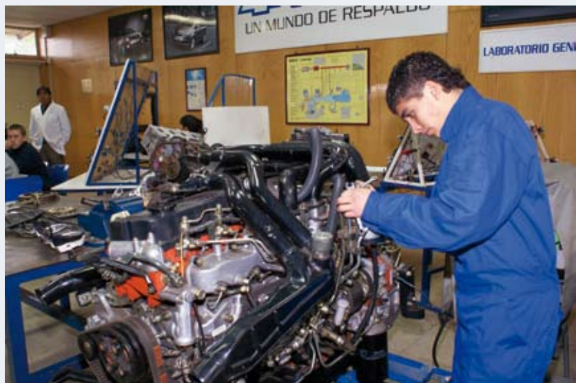
Estudiante de mecánica automotriz de Liceo Industrial Domingo Matte Pérez

Con este fin, la Corporación de Capacitación y Empleo SOFOFA, organismo privado, sin fines de lucro, desde su creación en 1978, viene desarrollando diversas líneas de trabajo en capacitación laboral, desarrollo de la formación y educación continua y dual, a la vez, que satisfaciendo la demanda de personal calificado del sistema productivo.