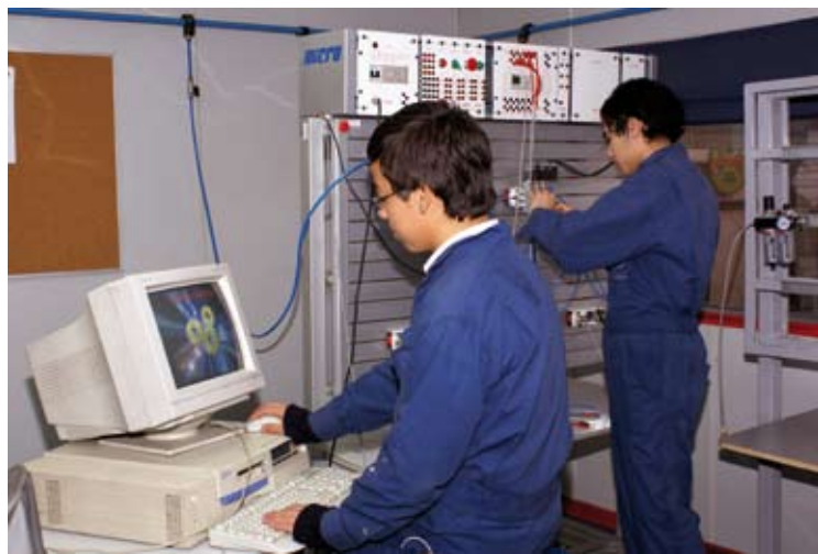
Electricidad es una de las especialidades que se imparte en el Liceo Vicente Perez Rosales