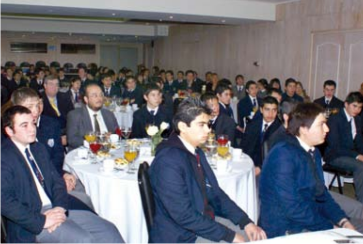
Alumnos de los cinco liceos que administra la Corporación SOFOFA en una Reunión-Desayuno, donde el destacado montañista y emprendedor Rodrigo Jordan les dio una charla sobre habilidades sociales y personales para el éxito laboral.