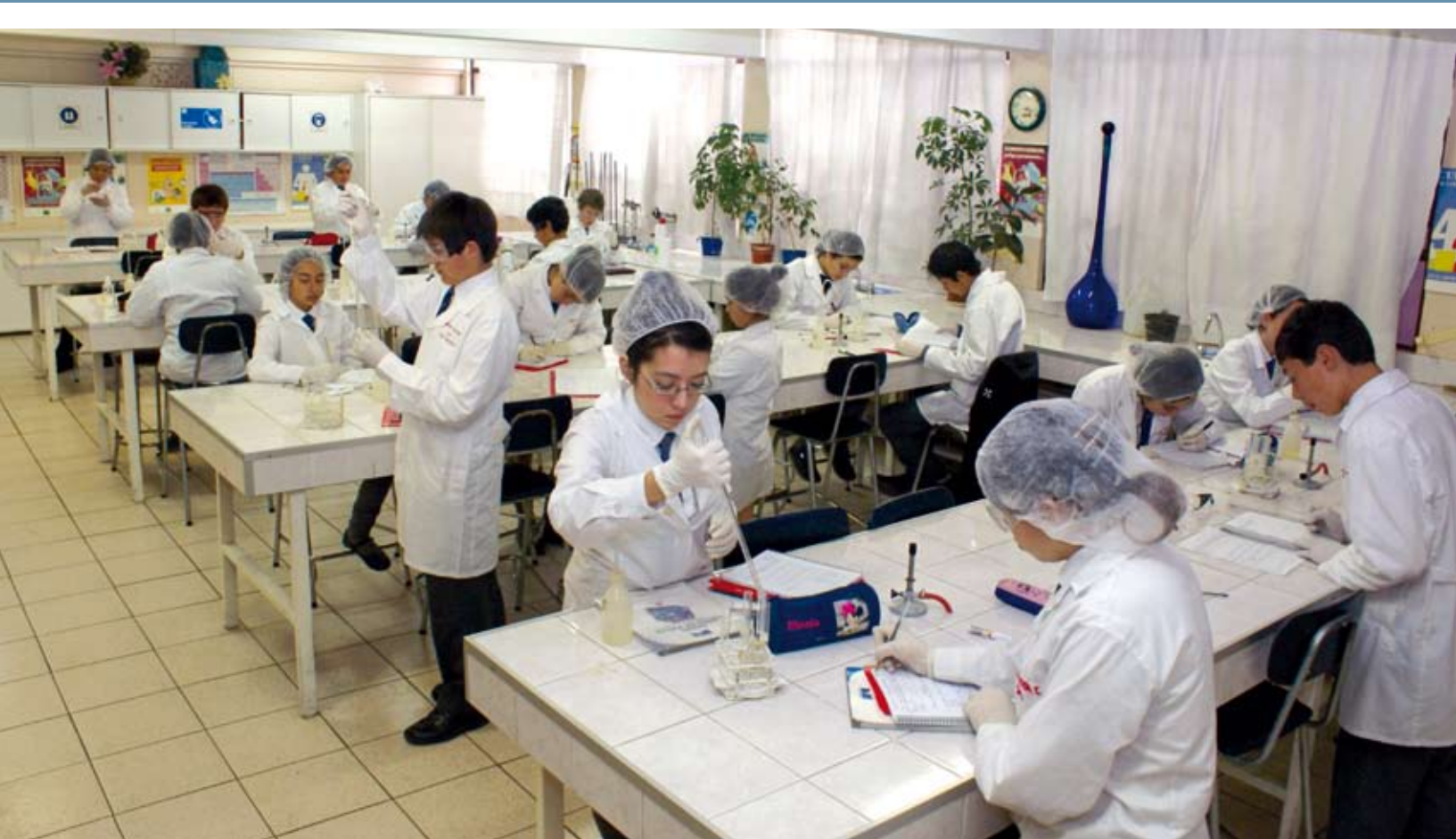
Laboratorio químico de Liceo Industrial Benjamín Dávila Larraín.